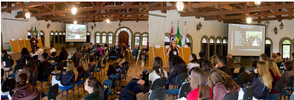
Apresentação dos programas educativos por representantes das instituições convidadas.

Na segunda etapa do Simpósio, após as apresentações, foram montados quadros com os principais elementos fornecidos, como meio de subsidiar as discussões acerca da realidade da Educação Ambiental vivenciada pelos associados. A palavra também foi aberta aos ouvintes que quisessem complementar os dados obtidos com informações de suas instituições, caso suas experiências fossem distintas das apresentadas, concluindo assim a fase de diagnóstico.