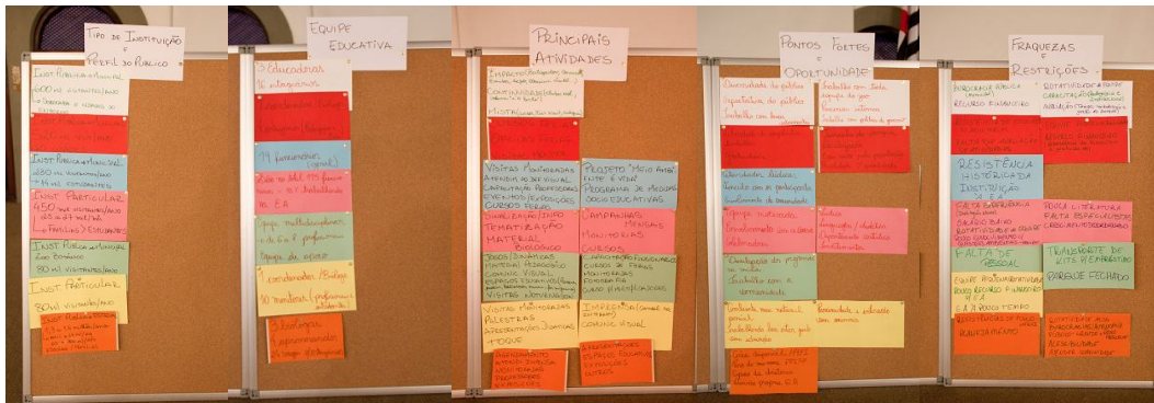
Exposição das informações referentes à Educação Ambiental nos Zoológicos e Aquários Paulistas, levantadas durante as apresentações.

Na segunda etapa do Simpósio, após as apresentações, foram montados quadros com os principais elementos fornecidos, como meio de subsidiar as discussões acerca da realidade da Educação Ambiental vivenciada pelos associados. A palavra também foi aberta aos ouvintes que quisessem complementar os dados obtidos com informações de suas instituições, caso suas experiências fossem distintas das apresentadas, concluindo assim a fase de diagnóstico.